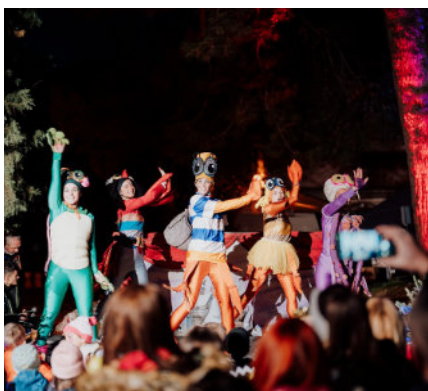
Veliko rođendansko slavlje obilježeno je tijekom cijele godine brojnim aktivnostima i projektima.

Rođendanska proslava u sklopu porečkog Adventa održana je 14. prosinca i otvorena je šarolikim sadržajem za najmlađe pod nazivom "Zimski Bal princeza"