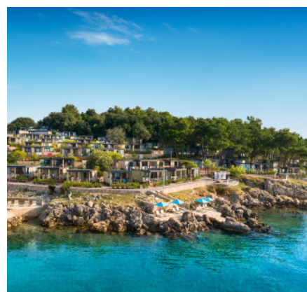
Ježevac Premium Camping Resort