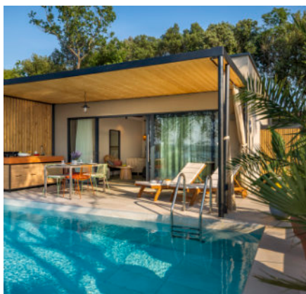
Istra Premium Camping Resort