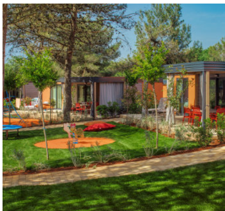
Lanterna Premium Camping Resort