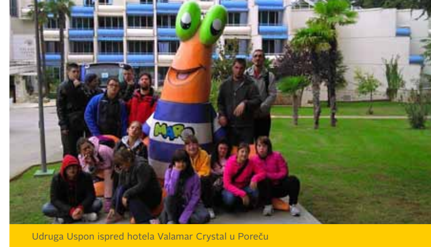
Udruga Uspon ispred hotela Valamar Crystal u Poreču

Udruga Uspon osnovana je 2011. godine na inicijativu roditelja djece i mladih s posebnim potrebama te njihovih profesora s ciljem organizacije i provođenja rehabilitacijskih postupaka i organiziranja slobodnog vremena. Volonteri u Udruzi održavaju redovite radionice, kao što su radionice izrade mirisnih sapuna, mirisnih soli, plesa, zdrave prehrane, zelene radionice sadnje cvijeća i jestivog bilja. Jedna od najzanimljivijih je