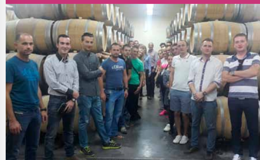
Kolege iz Valamara u posjeti podrumu Vina Laguna

Kroz ovakve edukacije, Valamar Riviera potvrđuje svoju dosadašnju dobru suradnju s partnerima te dodatno usavršava svoje zaposlenike na polju vrhunske prezentacije u ponudi vina. ■