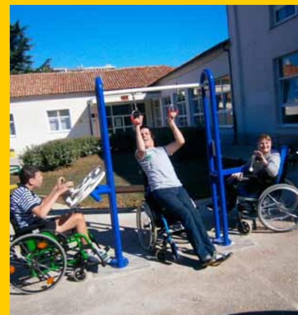
Nova sprava u centru „Liče Faraguna“

Tijekom ljetnih praznika u dvorištu Centra postavljena je i sprava za vježbanje primjerena djeci u invalidskim kolicima, pri čemu je pomogla donacija Valamar Rivijere. ■