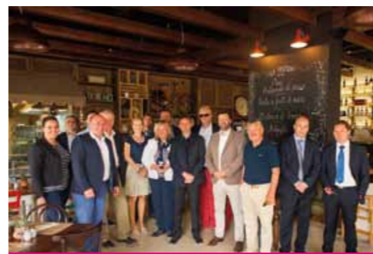
Izaslanstvo ADAC-a u posjeti Lanterni

Tijekom dvodnevne manifestacije na plaži sportskog centra Valeta na Lanterni, vozila se i fun utrka za rekreativce, igrao SUP polo turnir te Starship utrka SUP osmeraca, a održane su i brojne zabavne i nagradne igre za sve posjetitelje. ■