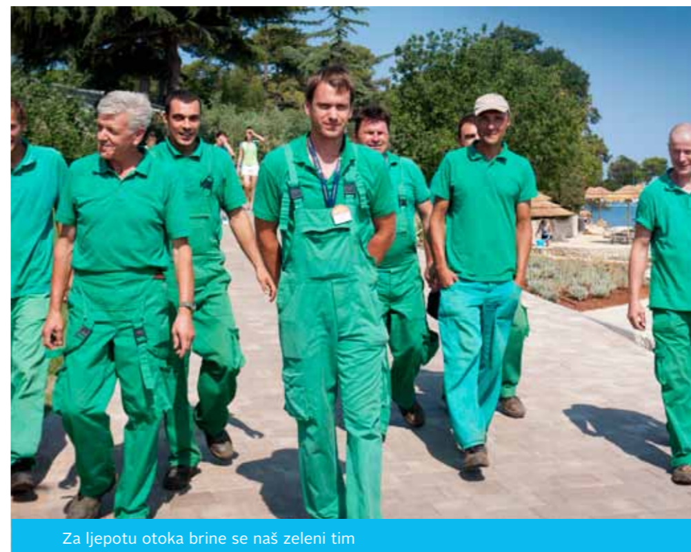
Za ljepotu otoka brine se naš zeleni tim