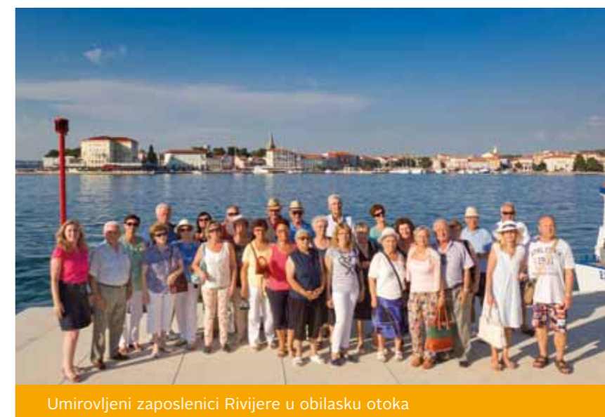
Umirovljeni zaposlenici Rivijere u obilasku otoka

U obilasku otoka bilo je tridesetak umirovljenika. Svi su bili ugodno iznenađeni i nisu skrivali svoje oduševljenje uredjenjem otoka, posebno obnovom depandanse Miramare i starog svjetionika. Zadovoljno su konstatalirali da se vidi kako je posebna pažnja posvećena hortikulturi i da su se