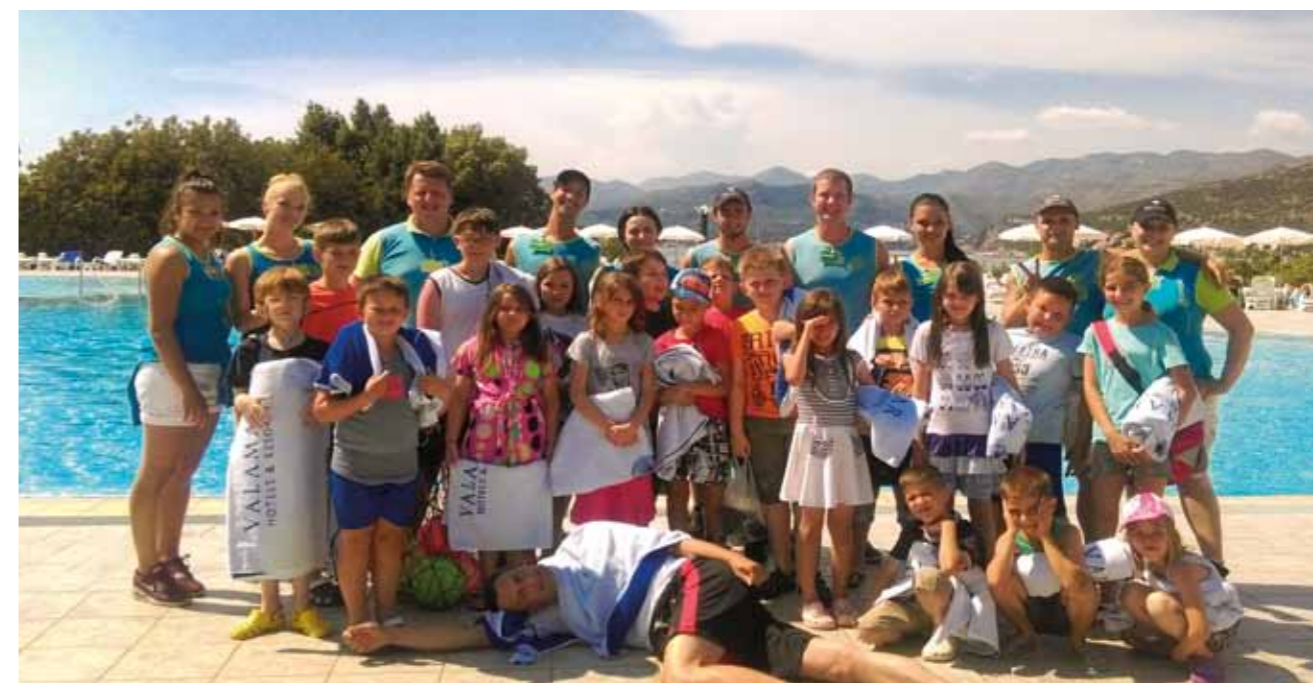
Djeca iz OŠ „Mate Lovrak“ u Dubrovniku - Tisuću dana na Jadranskom moru

U sklopu programa „Tisuću dana na Jadranskom moru“ početkom lipnja je u hotelu Valamar Club Dubrovnik u Dubrovniku boravila grupa od 23 djece i 3 voditelja iz Osnovne škole Mate Lovraka iz Petrinje. Riječima nije moguće opisati sreću i zadovoljstvo djece koja su provela nekoliko nezaboravnih dana u Dubrovniku. Svakodnevno su se zabavljali na hotelskom bazenu i pregrštu aktivnosti s Valamarovim animatorima, dok ih je posjet staroj gradskoj jezgri u pratnji stručnog vodiča ostavio bez daha. ■