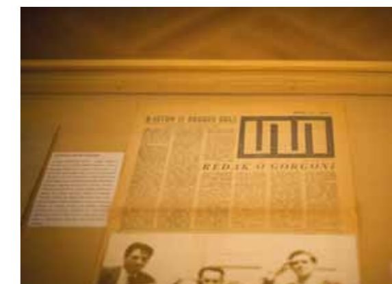
Dokumentacija grupe Gorgona

Izložbu „Gorgona nekad i danas“ pripremili su Institut za istraživanje avangarde, u suradnji s Kolekcijom Marinko Sudac i tvrtkom Valamar Riviera, a javnosti uz poznate radove predstavila i dosad neizlagana umjetnička djela te dokumentaciju članova grupe. Izložba je bila ujedno i uvod u monografiju „Gorgona“ koju priprema Institut za istraživanje avangarde, a izdat će se tijekom godine. ■