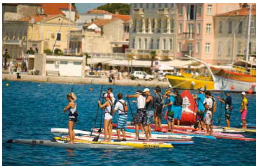
SUPER Surfers Challenge

Kamp Lanterna u Poreču nalazi se u elitnoj udruzi "Leading Campings of Europe" koja okuplja 40 najboljih kampova u Europi, a osvojila je i priznanje BEST, odnosno 5* od strane uglednih kamping udruženja ADAC i ANWB. Uz Lanternu, i Kamp Krk je od ove godine jedini kamp na Kvarneru i ukupno treći u Hrvatskoj u ovoj elitnoj grupi europskih kampova. ■