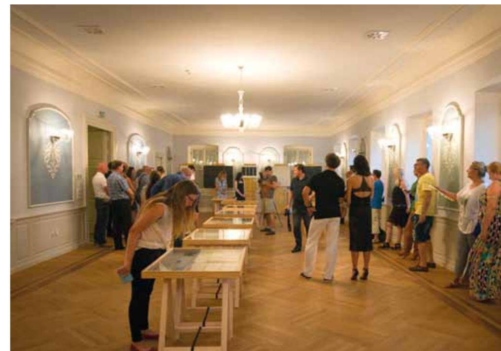
Izložba „Gorgona nekad i danas“ u Villi Polesini