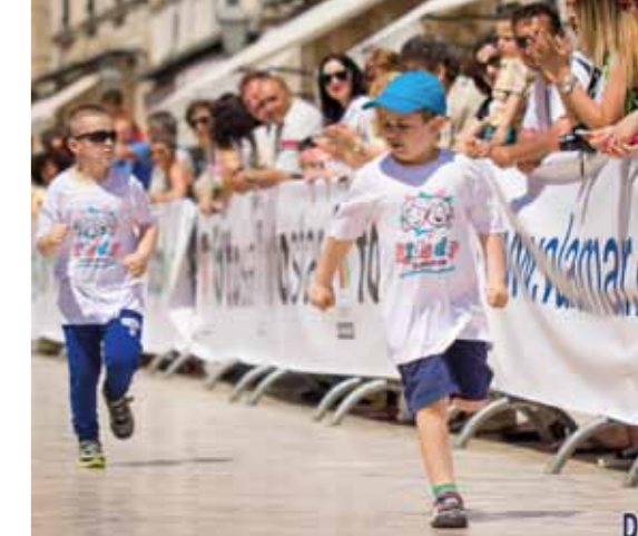
Prvi dubrovački međunarodni polumaraton

Ovaj sportski događaj, koji je zapravo i prvi međunarodni sportski događaj ove vrste, stvara dodatnu mogućnost promocije Dubrovnika u proljeće kao destinacije vrlo pogodne i za bavljenje različitim sportskim aktivnostima. ■