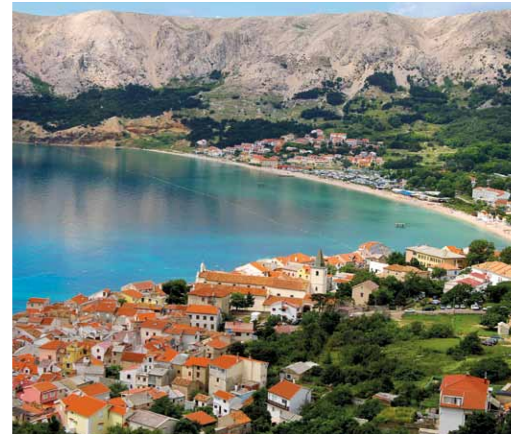
Baška na otoku Krku