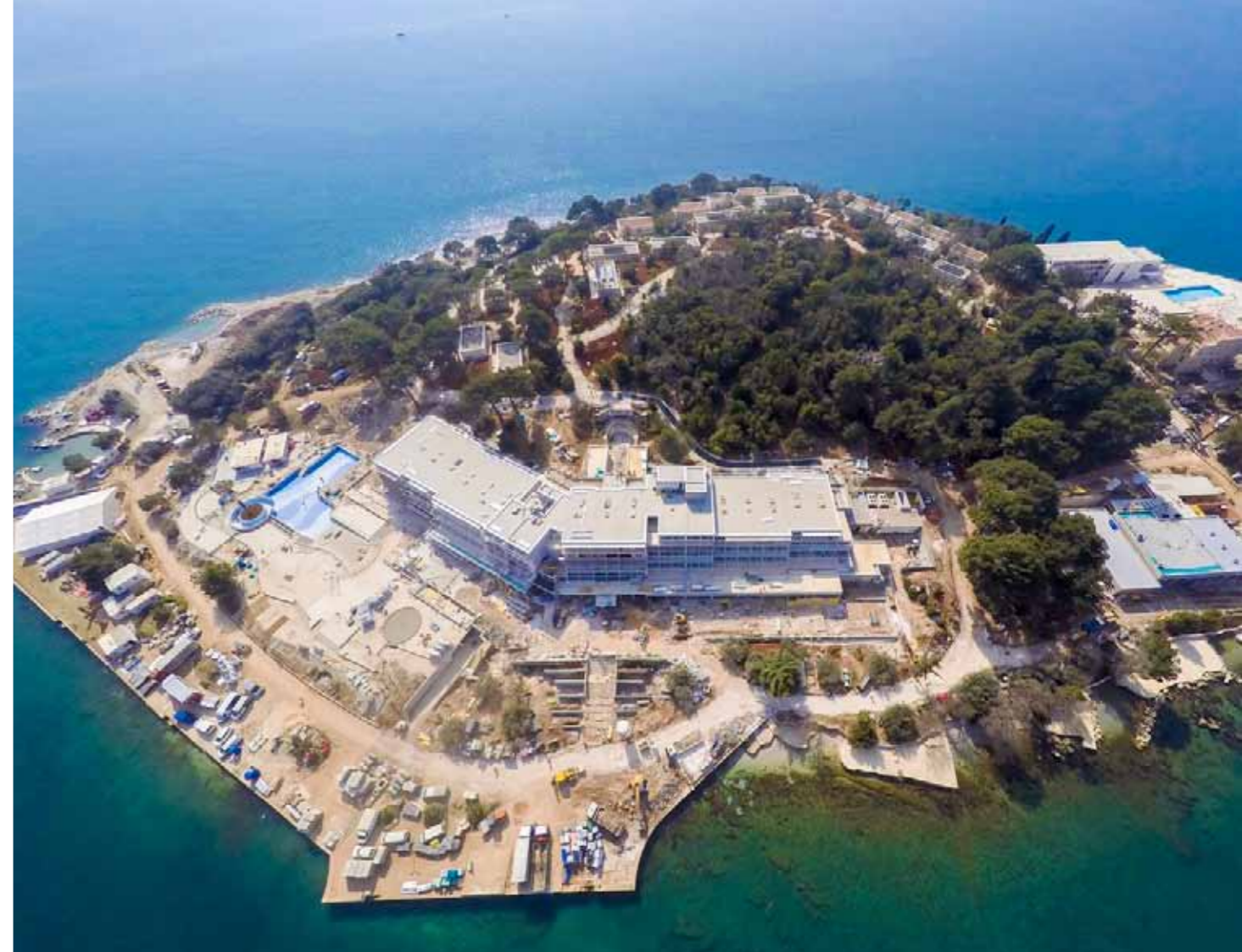
Valamar Isabella Island Resort tijekom građevinskih radova

Dubrovnik President 5* bio je nam izazov jer osim rekonstrukcije postojećeg objekta i dogradnje novih sadržaja zahtijevao je specifičnu izvedbu vertikalnih liftova u stijeni umjesto dotadašnjih kosih panoramskih, a sve to izveli smo u ukupnom roku od 7 mjeseci za što je bilo potrebno organizirati i više smjenski rad.