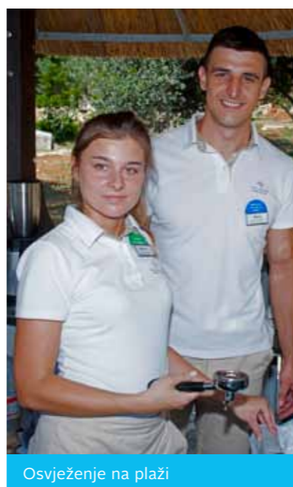
Osvježanje na plaži