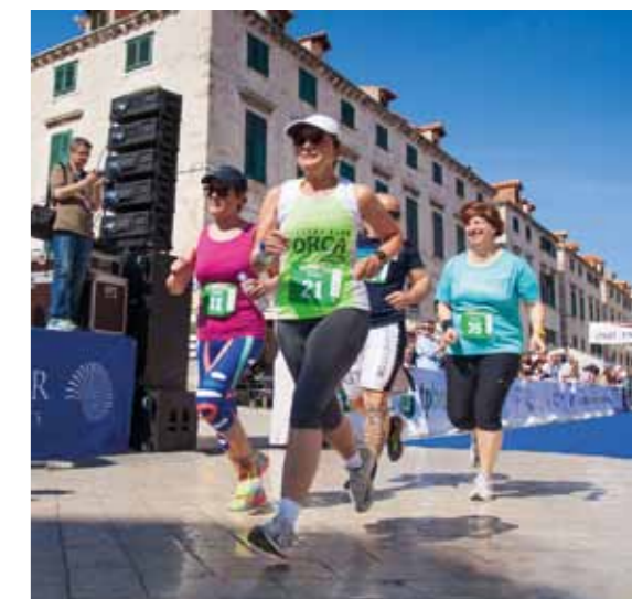
Prvi dubrovački međunarodni polumaraton