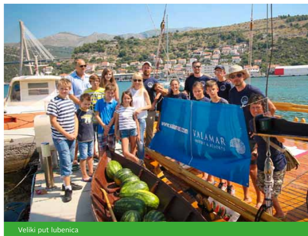
Veliki put lubenica

Ovogodišnji Veliki put lubenica započeo je u Kaštelima, a nastavio se plovidbom do Neretve s petero šticićenika iz Maestrala, gdje se u Pločama ukrcao veći broj lubenica. Na brodicama su učili sve potrebne vještine i s lubenicama plovili na Lovišće, u Vela luku, Brna, Lombardu, Koločep, a 14. srpnja su uplovili u Dubrovnik gdje su dio preostalih lubenica poklonili djeci Doma 'Maslina'. ■